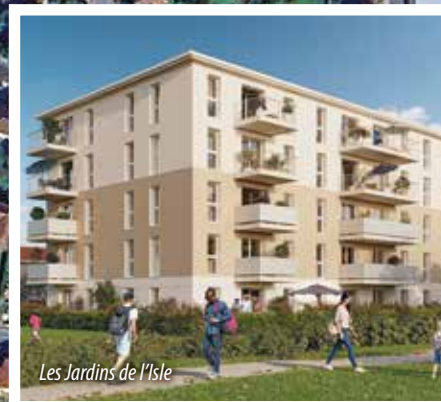
Les Jardins de l'Isle