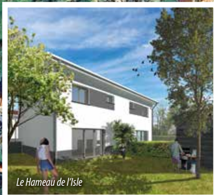
Le Hameau de l'Isle

Ces efforts portent leurs fruits. Le nombre moyen de permis de construire délivrés entre 2020 et 2024 a presque triplé par rapport aux 5 années précédentes, la majorité des terrains du lotissement Bellevue ont été vendus sur les 2 dernières années. Sur ce dernier trimestre, Coulounieix-Chamiers est la seule ville de l'agglomération à voir le prix de vente au m 2 progresser... La ville affiche une attractivité croissante, et confirme qu'il fait bon y vivre et y investir.