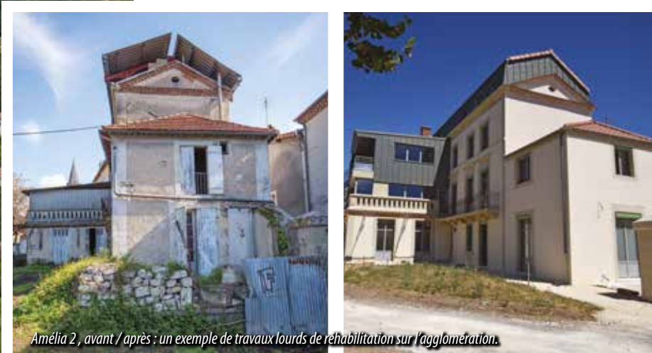
Amélia 2, avant / après : un exemple de travaux lourds de réhabilitation sur l'agglomération.

Près de la moitié des logements de Coulounieix-Chamiers ont été construits avant 1970, à une époque où les normes thermiques n'existaient pas. Dans ce contexte, la rénovation des habitations représente une solution clé pour offrir un meilleur confort aux habitants, diminuer les factures énergétiques, accroître la valeur des biens, tout en préservant le cadre de vie et l'attractivité de la commune.