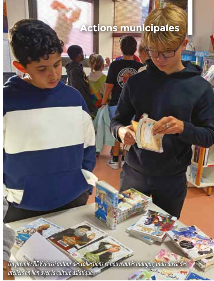
Un premier RDV réussi autour des collections et nouveautés mangas, mais aussi des ateliers en lien avec la culture asiatique.

📍 Bibliothèque-ludothèque François-Rabelais ☎ 05.53.54.03.02 ✉ bibliotheque@coulounieix-chamiers.fr