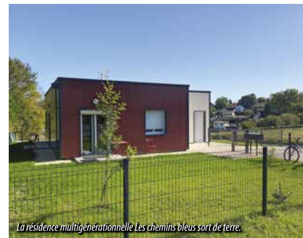
La résidence multigénérationnelle Les chemins bleus sort de terre.

De grands projets de construction transforment le paysage urbain de Coulounieix-Chamiers. Aux côtés du programme ANRU, des initiatives nouvelles vont redessiner les quartiers et renforcer l'offre en centre ville et au-delà, avec des logements modernes, écoresponsables et adaptés aux besoins.