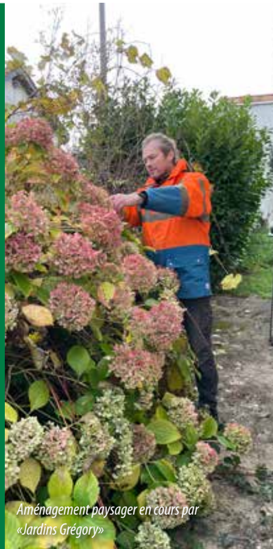
Aménagement paysager en cours par «Jardins Grégory»

📍 356 bis av Winston Churchill ☎ 05.53.08.35.41 ✉ coulounieixautos@outlook.com