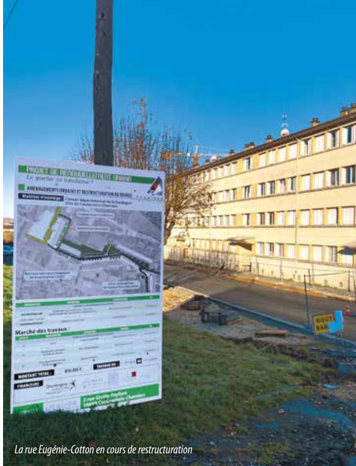
La rue Eugénie-Cotton en cours de restructuration

Parmi les travaux réalisés par les entreprises locales, on compte notamment l'entretien de la voirie (rues de la Liberté, Jean-Bouin, du 14 juillet, Tjibaou,...) et la pose de menuiseries aluminium double et triple vitrage à l'école élémentaire Louis-Pergaud dans le cadre du projet de rénovation énergétique globale (entre les vacances de Toussaint et les vacances d'hiver). Dans le cadre du PRU, une partie de l'aménagement de la rue Eugénie-Cotton, désormais en sens unique, est terminée (entre la place Allende et la rue Venta de Baños) avec la reprise de la voirie, la création d'une piste cyclable et la réorganisation des stationnements végétalisés. Les travaux se poursuivent avec son prolongement jusqu'au bd Jean-Moulin, la réfection de la rue Yves-Farges et la création d'une nouvelle voie pour desservir les futurs logements.