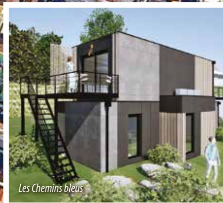
Les Chemins bleus