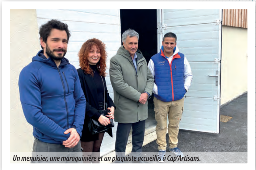
Un menuisier, une maroquinère et un plaquiste accueillis à Cap'Artisans.