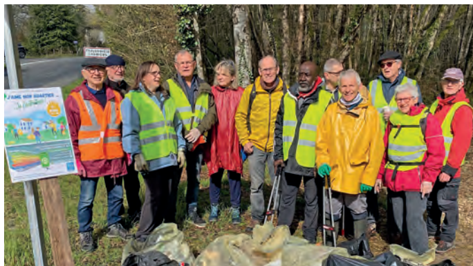
Plus de 400 kg de déchets ont été récoltés par une soixantaine de bénévoles lors de la première édition de « J'aime mon quartier, je l'entretiens ! »