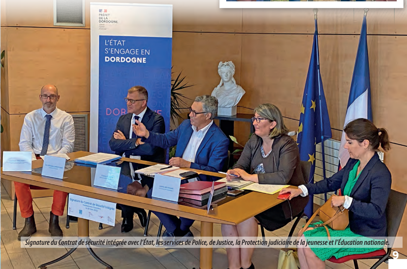
Signature du Contrat de sécurité intégrée avec l'État, les services de Police, de Justice, la Protection judiciaire de la jeunesse et l'Éducation nationale.