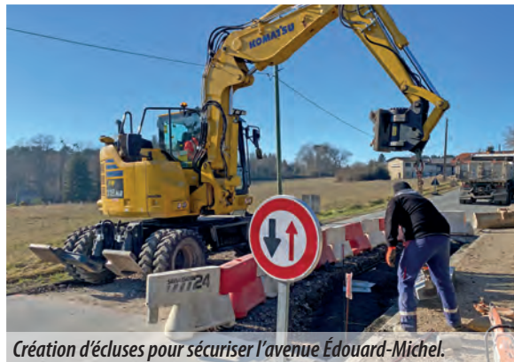
Création d'écluses pour sécuriser l'avenue Édouard-Michel.