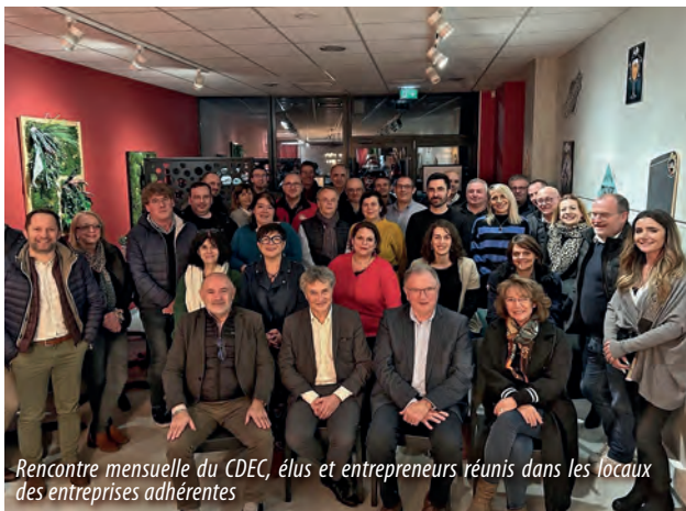
Rencontre mensuelle du CDEC, élus et entrepreneurs réunis dans les locaux des entreprises adhérentes

..... f @entrepreneurscreavallee M cdec24000@gmail.com