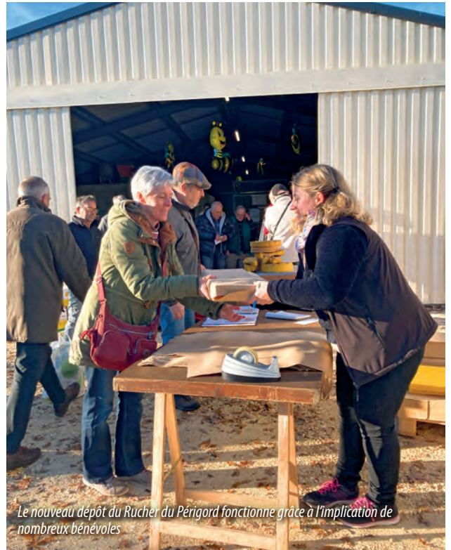
Le nouveau dépôt du Rucher du Périgord fonctionne grâce à l'implication de nombreux bénévoles