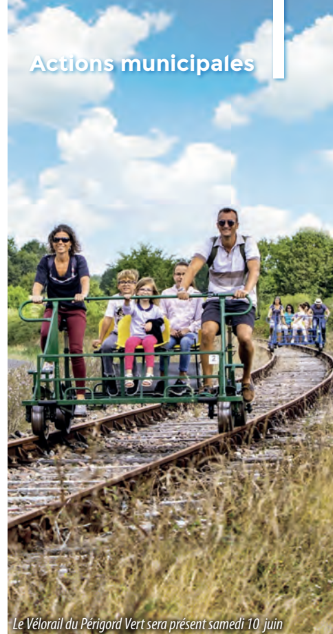
Le Velorail du Périgord Vert sera présent samedi 10 juin