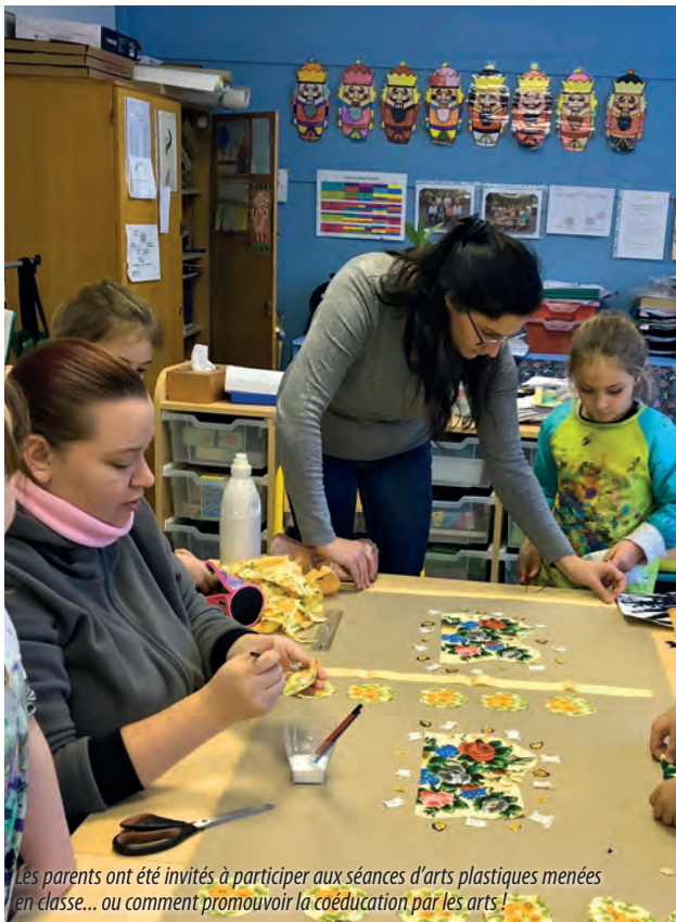
Les parents ont été invités à participer aux séances d'arts plastiques menées en classe... ou comment promouvoir la coéducation par les arts !