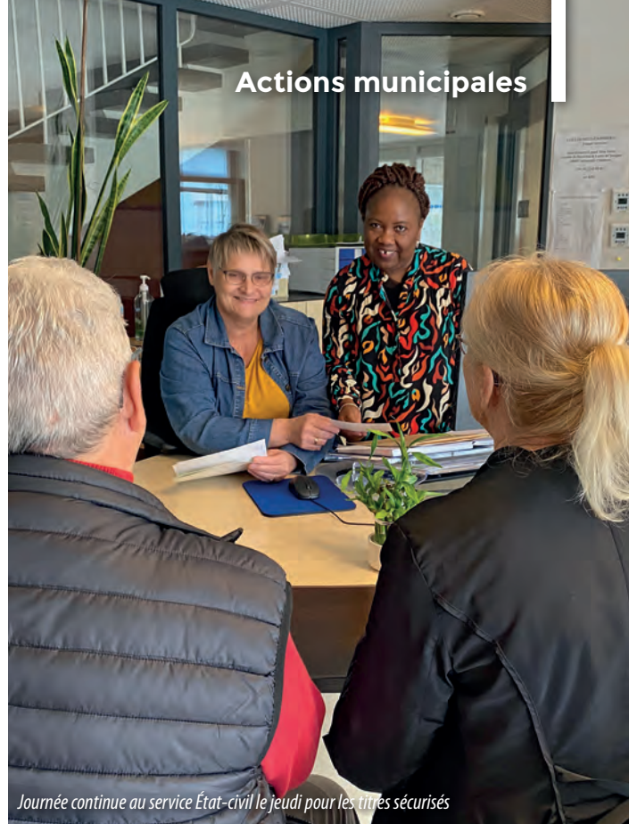
Journée continue au service État-civil le jeudi pour les titres sécurisés

Dans cette logique d'optimisation de l'accès aux services, une partie du pôle Education, jeunesse et vie associative va être regroupé au-dessus de la Poste (ancien CCAS), avec notamment le service Enfance (restauration, accueils périscolaires, activités extrascolaires) et le service Sport et transports.